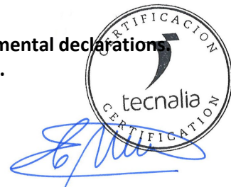
Carlos Nazabal Alsua Manager

Issued date / Fecha de emisión: 22/07/2024 Update date / Fecha de actualización: 22/07/2024 Valid until / Válido hasta: 19/07/2029 Serial Nº / Nº Serie: EPD1060600-E