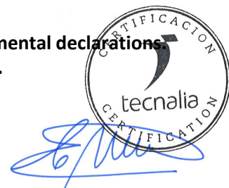
Carlos Nazabal Alsua Manager

Issued date / Fecha de emisión: 22/07/2024 Update date / Fecha de actualización: 22/07/2024 Valid until / Válido hasta: 19/07/2029 Serial N o / N o Serie: EPD1061200-E