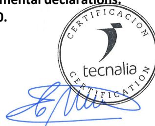
Carlos Nazabal Alsua Manager

Issued date / Fecha de emisión: 22/07/2024 Update date / Fecha de actualización: 22/07/2024 Valid until / Válido hasta: 19/07/2029 Serial N° / N° Serie: EPD1060900-E