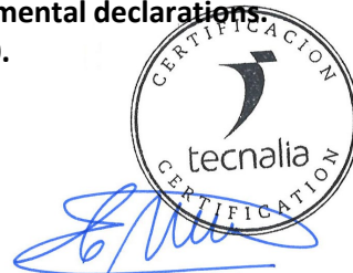
Carlos Nazabal Alsua Manager

Issued date / Fecha de emisión: 22/07/2024 Update date / Fecha de actualización: 22/07/2024 Valid until / Válido hasta: 19/07/2029 Serial N° / N° Serie: EPD1060200-E